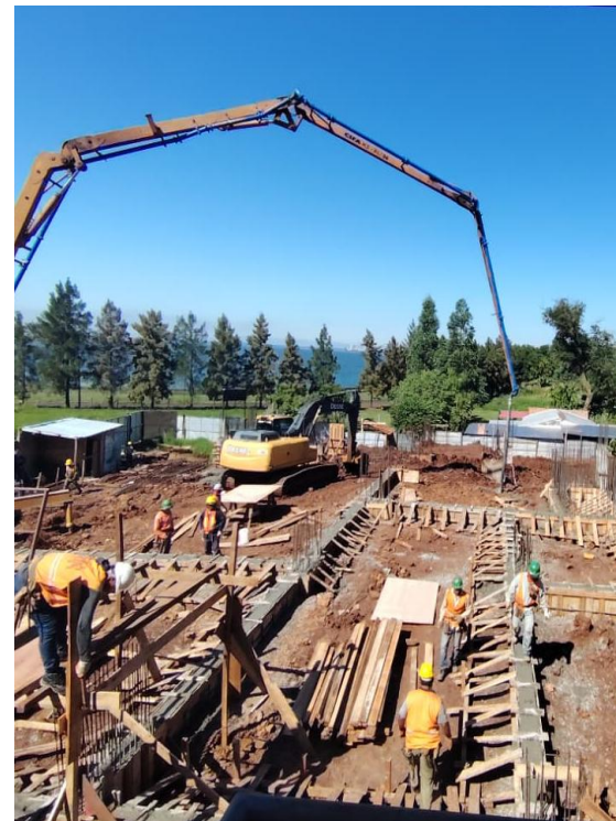
Armado, encofrado y hormigonado de vigas de fundación