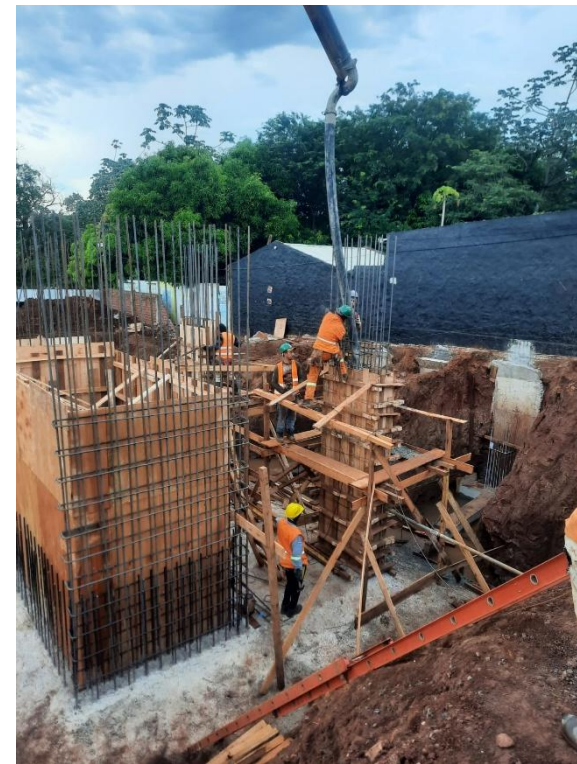
Armado, encofrado y hormigonado de fustes